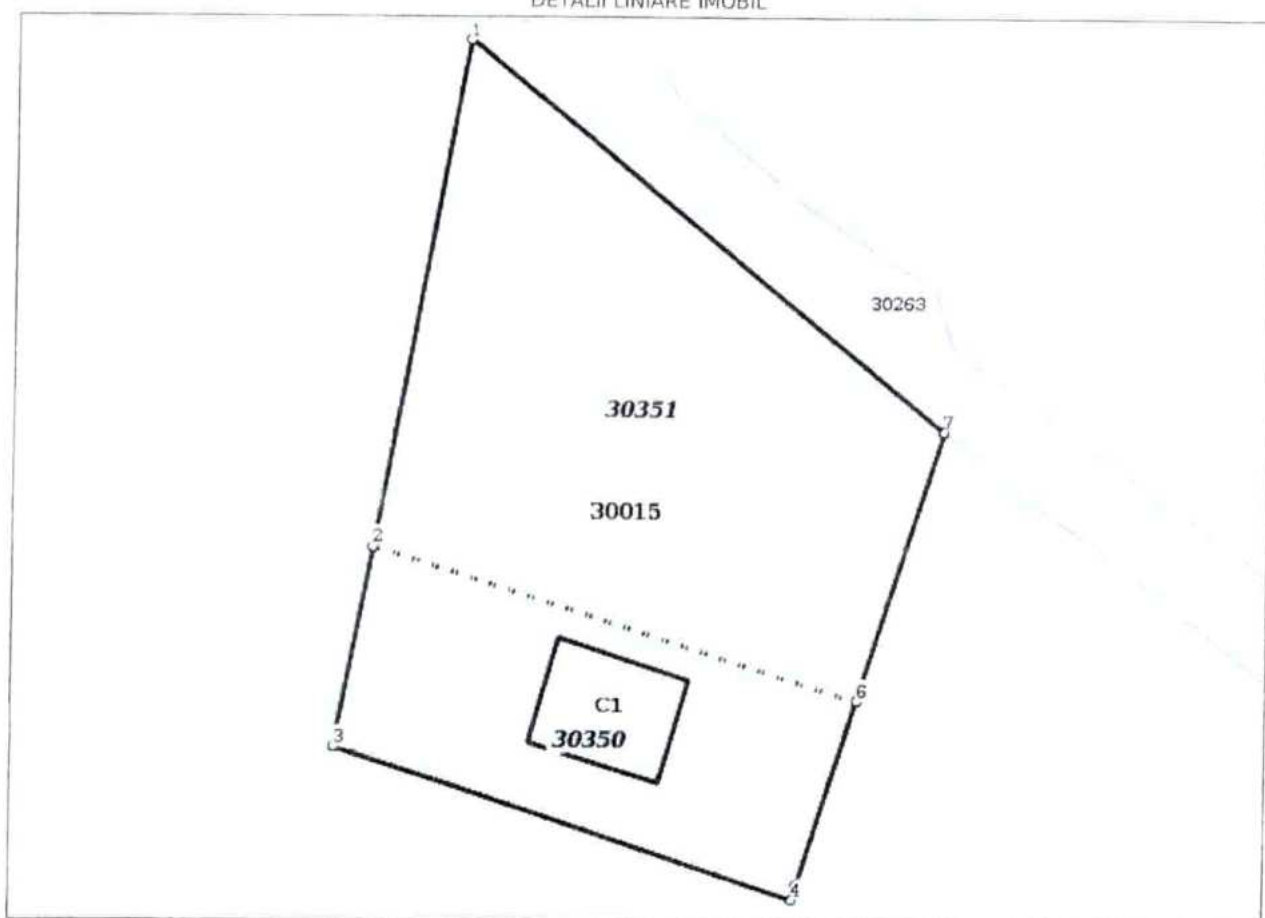
DETALII LINIARE IMOBIL

* Suprafața este determinată în planul de proiecție Stereo 70.